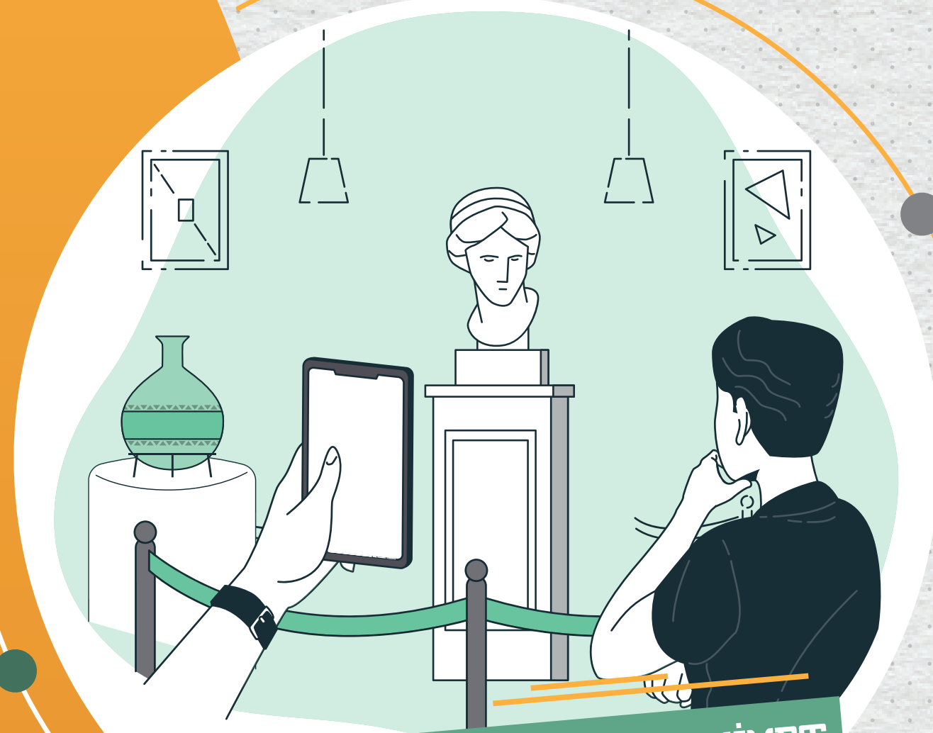
TARİH KÜLTÜR VE MEDENİYET KAMPLARI